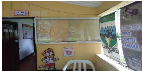
Sede Patio Bonito